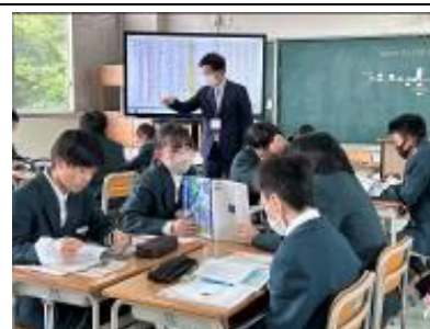
道徳の授業の様子