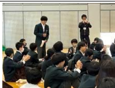
「いじめゼロ宣言」の発表